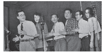
多分『日曜娯楽版』の録音

『千と千尋の神隠し』では「河の神」役で声優も務めたが、2016年に他界してしまった。 以上