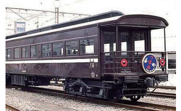
特急つばめの一等展望車